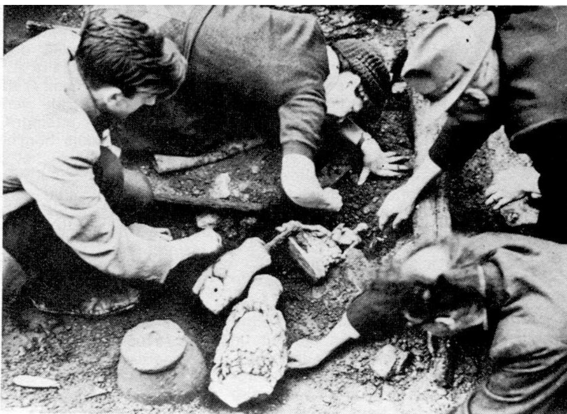
Le passé surgit du sol de Londres

Ce qui intrigua fort les archéologues londoniens, qui n'ont d'ailleurs pas pu donner une réponse satisfaisante au problème soulevé, c'est ce curieux rassemblement de divinités. Sérapis, c'est à l'origine un dieu égyptien, qui a été plus tard confondu avec Jupiter et avec Pluton