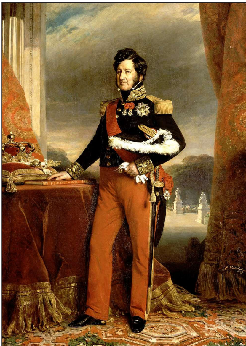
Louis-Philippe I er

6 octobre 1773 à Paris, † 26 août 1850 à Claremont House au sud de Esher , dans le comté de Surrey. En 1839 par Franz Xaver Winterhalter. Musée de Versailles