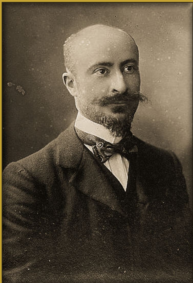
Urbain Gohier, de son nom de naissance Urbain Degoulet, a signé deux de ses livres du nom de plume Isaac Blümchen, né à Versailles le 17 décembre 1862 et mort le 29 juin 1951, est un avocat, journaliste et écrivain français.