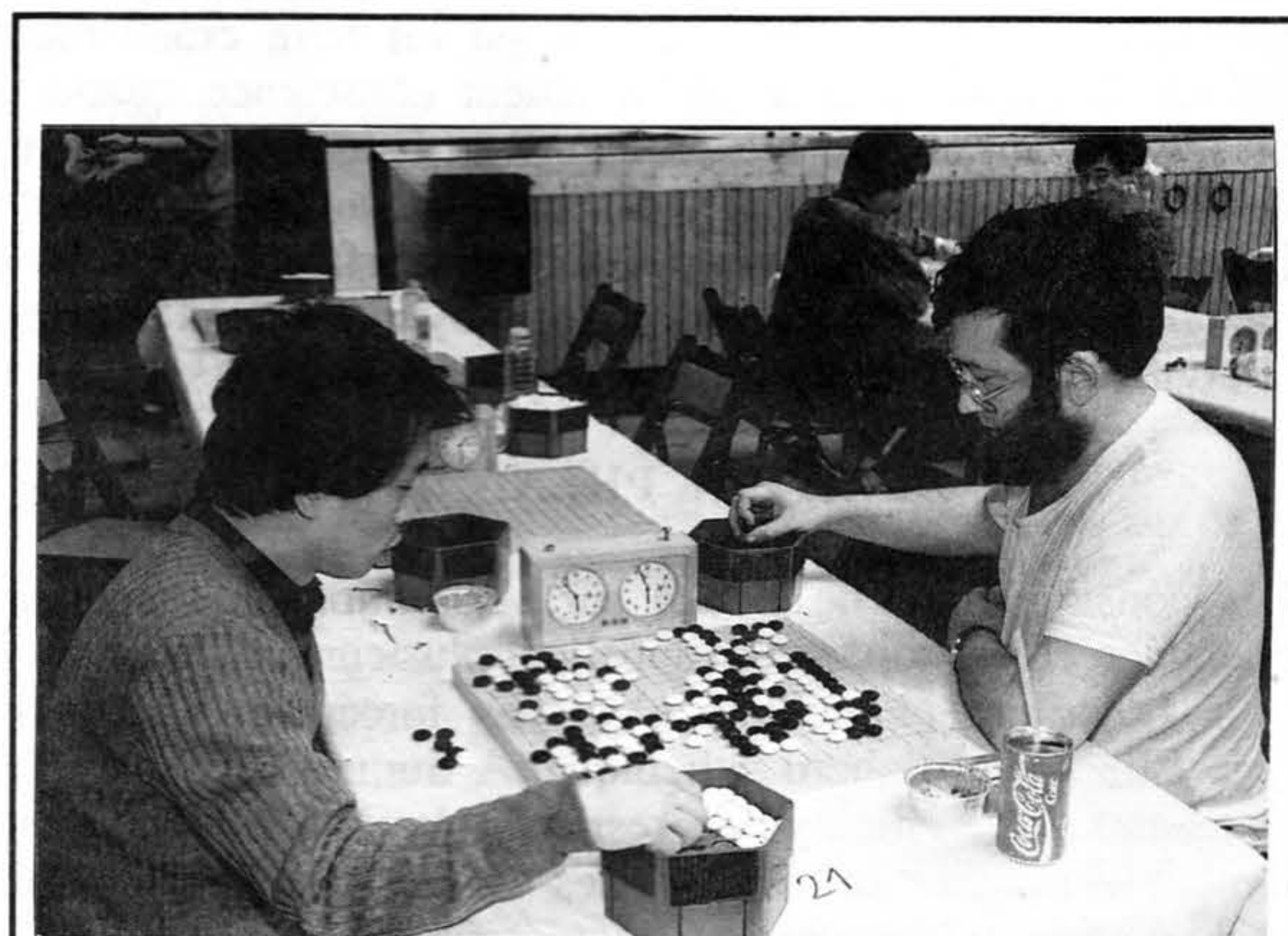
Face à face, Attila et Rhee, dit Le Cruel.