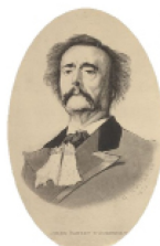
J. BARBEY D'AUREVILLE