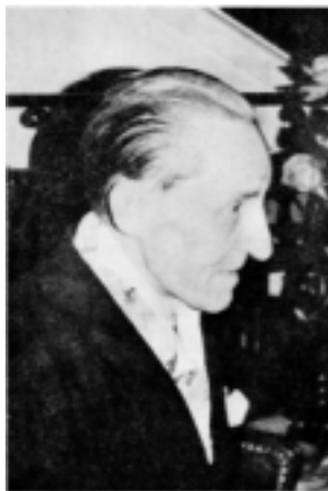
Léon de Poncins (3 novembre 1897-18 décembre 1975)

Le célèbre auteur français écrit: «Il n'est pas douteux que les Juifs aient une organisation très disciplinée. Il est presque impossible à un non-Juif d'en pénétrer les détails