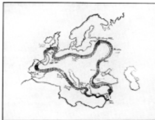
Le serpent symbolique qui représente le progrès de la conspiration juive