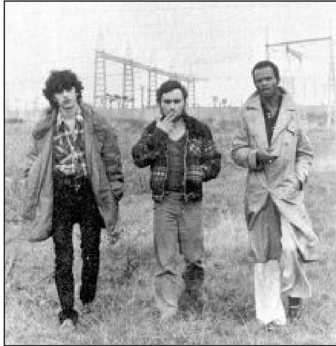
Le trio de Cergy : trois témoins « dignes de foi »...