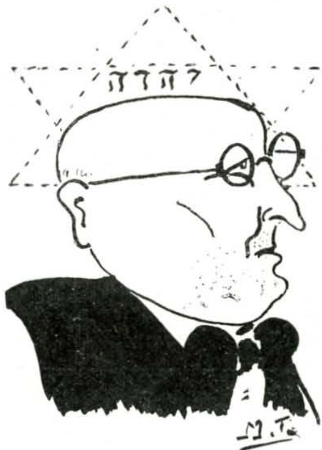
Juif VICTOR BASCH, Président de la L. D. H.