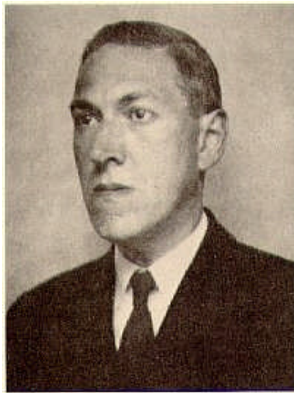
Howard Phillips Lovecraft