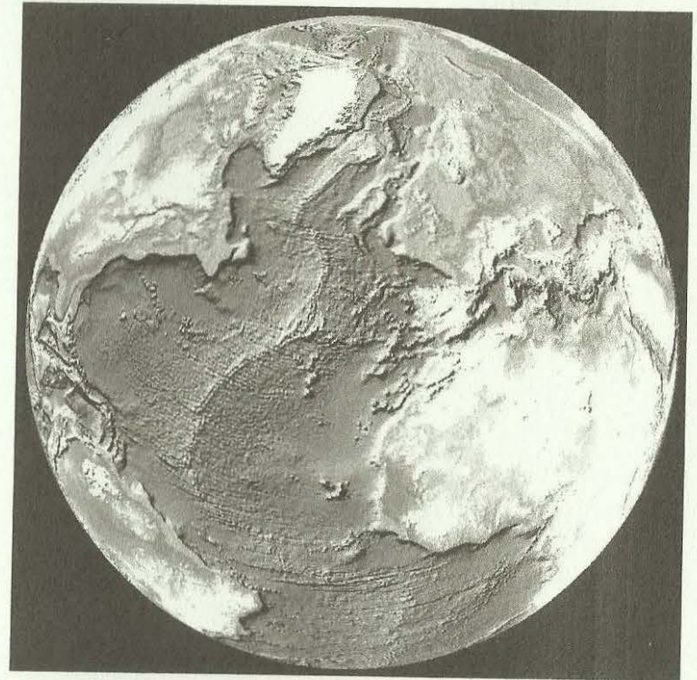
La chaîne dorsale, enfouie sous l'océan Atlantique, sépare les Amériques ( à gauche ) de l'Europe-Afrique ( à droite ).

La première carte mondiale des fonds marins a été dressée par les sous-marins américains dans le cadre d'un programme top-secret mené pendant la guerre froide pour le compte de l'agence de renseignements NSA*. Dans les années 1970 les scientifiques ont été totalement surpris lorsque l'US Navy et la NSA ont rendu cette carte publique où la Terre semble avoir été tor- due par une main géante.