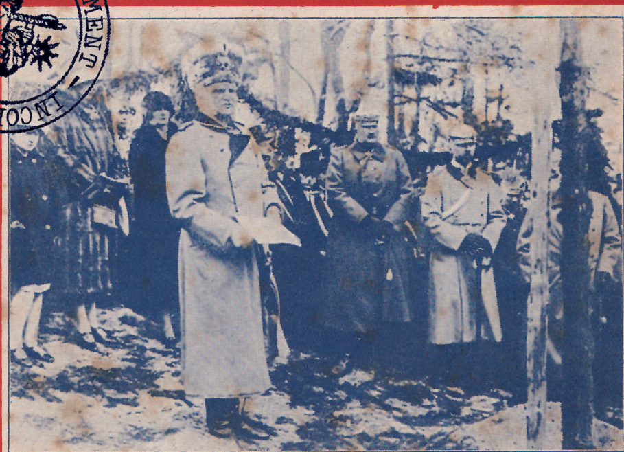
Le maréchal von Mackenzen prononçant un discours gallophobe devant les fils et la bru du kaiser

Chaque fascicule contient un récit complet