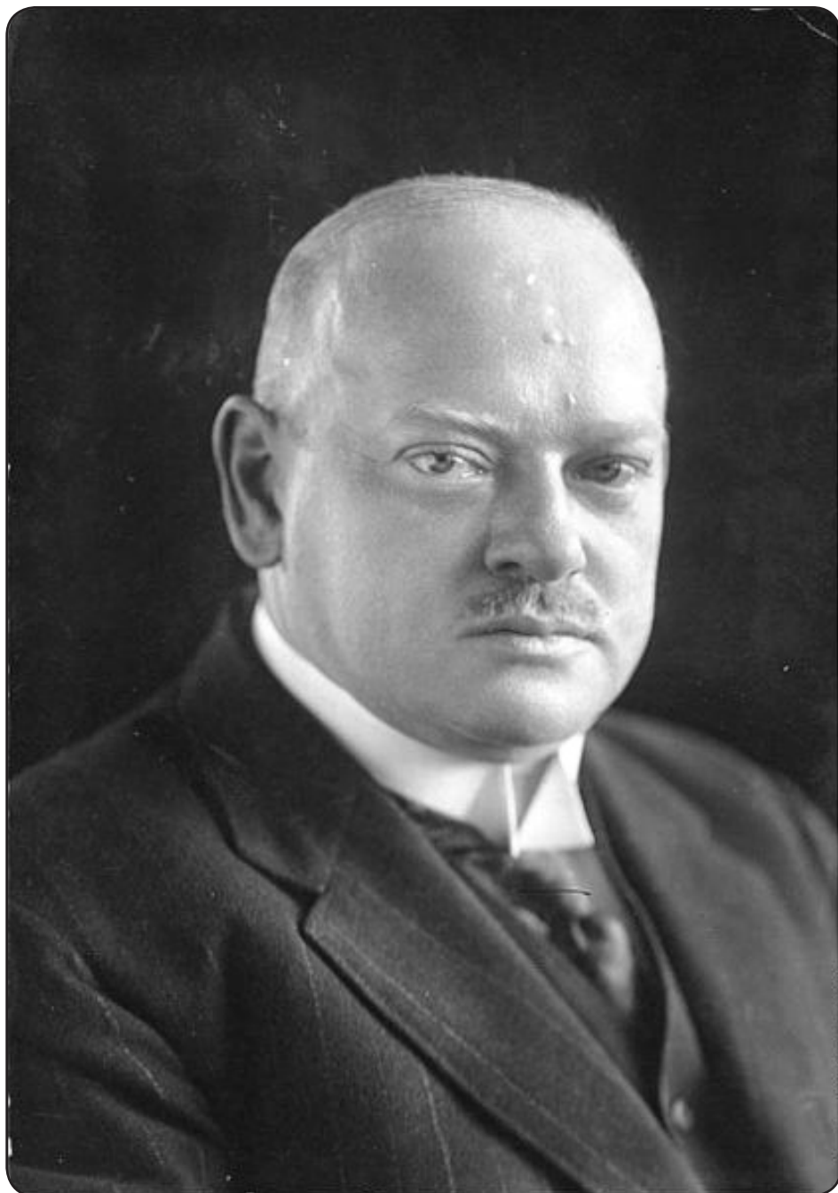
Gustav Stresemann (né le 10 mai 1878 à Berlin et mort le 3 octobre 1929 à Berlin).

Homme politique allemand, fondateur et dirigeant du Deutsche Volkspartei, chancelier en 1923 et ministre des Affaires étrangères de 1923 à sa mort. Figure incontournable de la République de Weimar, Gustav Stresemann a permis à l'Allemagne de retrouver un poids diplomatique et économique perdu après la Première Guerre mondiale en mettant en œuvre une politique pragmatique.