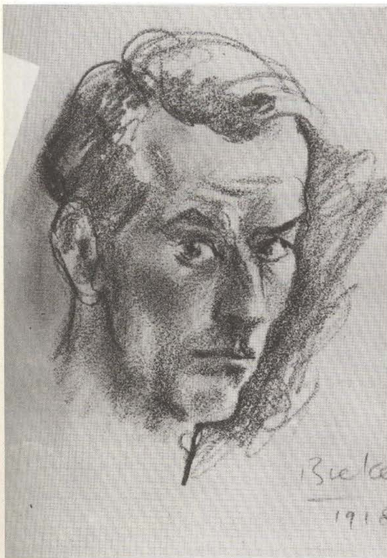
Arno Breker a dix-huit ans lorsqu'il réalise cet autoportrait au fusain. Fils de sculpteur, il a pris la direction de l'atelier paternel en 1916, lorsque son père a été appelé sous les drapeaux. C'est de cette époque que date son intérêt pour l'œuvre de Rodin.