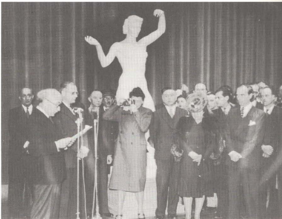
Abel Bonnard et Jacques Benoist-Méchin (à gauche sur la photo) inaugureront le 18 mai 1942 l'exposition organisée au musée de l'Orangerie. « Je ne viens pas faire de la propagande, avait déclaré Arno Breker, je viens simplement soumettre mes travaux au pays de Rodin, de Maillol et de Despiau, envers qui j'ai, en tant qu'artiste, une dette de reconnaissance à payer. »

moins les groupes qui ont figuré sur le parvis du pavillon allemand de l'Exposition de 1937. Pourquoi ne pas avouer qu'ils s'inscrivaient tout à fait dans l'esprit de l'architecture du tout neuf palais de Chaillot, ensemble mussolinien qui parut sans doute « futuriste » dans les années 30 et représente une des dernières tentatives de monument symétrique « à la française » (voir Versailles, les Invalides ou l'Ecole militaire), avant l'ère de la pyramide-verrue et de l'arche de la Défense entourée de gratte-ciel semés en désordre comme autant de gigantesques morceaux de sucre.