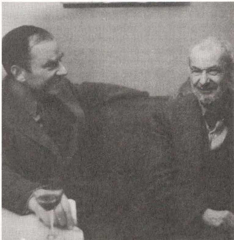
Arno Breker et Charles Despiau se sont connus à Paris à la fin des années 20.

Dans le sillage de Speer, son ami Breker va tourner le dos au Vieux Nord, exalté par les éléments ruraux et « écolos » du régime — ce que l'on