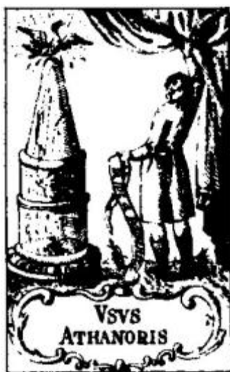
Usage de l'Athanor pour cet œuvre.

Il y à dans l'Athanor trois globes, le premier est très grand & est entier, le moyen est percé dans sa partie supérieure, afin que la vapeur de l'eau puisse s'échapper, le troisième est de bois de chêne, & c'est celui dans lequel se fait la putréfaction au moyen du feu de vapeurs. Il doit y avoir dans ce dernier globe une quantité suffisante d'eau, & si elle s'évapore, il faut en mettre de la nouvelle qui soit chaude. Cette putréfaction s'achève en 40 ou 45 jours, & c'est alors que paraît ordinairement la noirceur qu'on a nommée Tête de corbeau. Lorsque la putréfaction est finie, ôtez le globe de bois, parce qu'il n'est plus besoin d'eau pour le reste de l'ouvrage. Vous mettrez donc le vase dans le globe percé, que vous remplirez de cendres. Votre feu doit être doux, & tel que la main puisse le supporter sans aucune peine ; & en 50 jours, vous verrez paraître les couleurs connues sous le nom de la queue de paon, dont il ne restera enfin que la seule couleur verte. Otez alors le vase, & mettez-le dans le premier globe, qui est le plus grand, & qui doit être plein de sable, afin de pouvoir en recouvrir facilement le vase qui renferme la matière & qui doit être bien bouché. Ouvrez l'Athanor, augmentez le