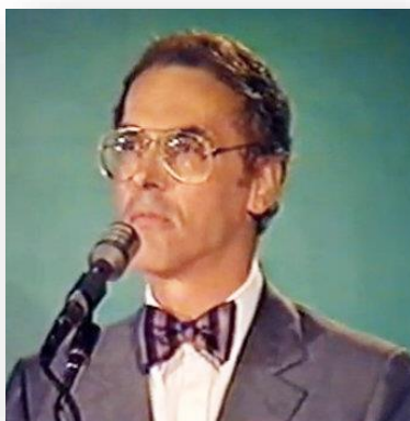
Bernard de Montréal