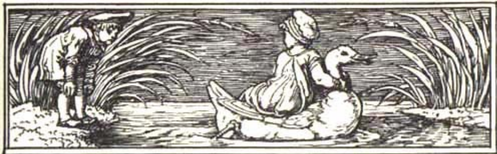
Dessin de Walter Crane

Le petit canard s'approcha et Hansel se mit à califourchon sur son dos. Il demanda à sa sœur de prendre place à côté de lui.