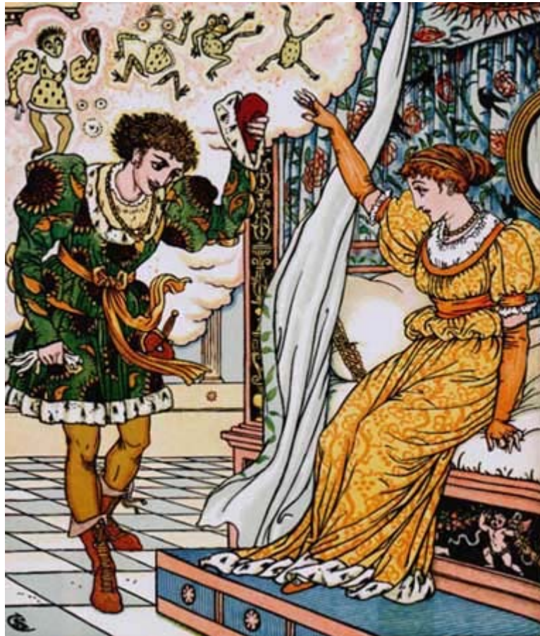
Dessin de Walter Crane

– Comme ça tu dormiras, affreuse grenouille !