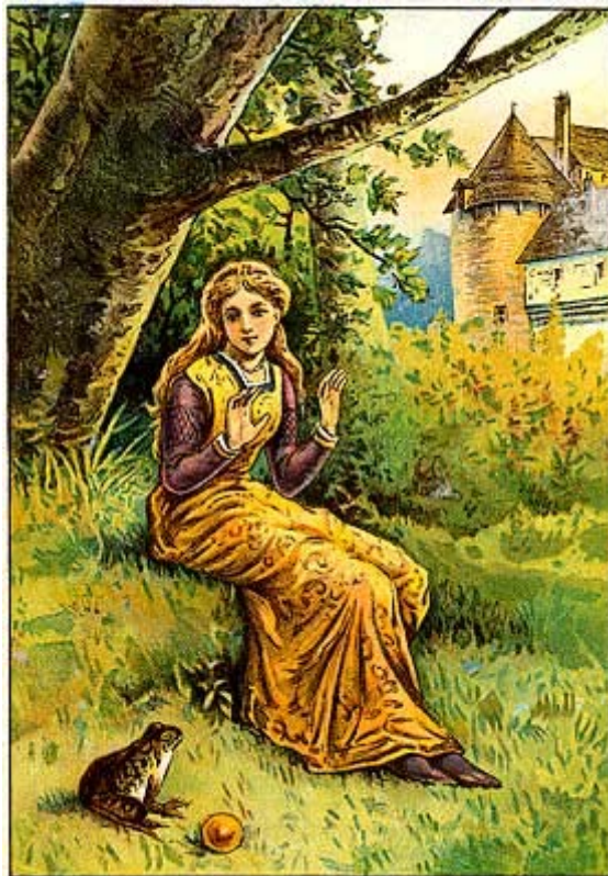
Dessin de Henry Altemus

Par deux fois encore, en cours de route, on entendit des craquements et le prince crut encore que la voiture se brisait. Mais ce n'était que les cercles de fer du fidèle Henri, heureux de voir son seigneur délivré.