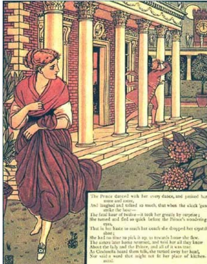
Dessin de Walter Crane

Le lendemain matin, il vint trouver le vieil homme avec la pantoufle et lui dit :