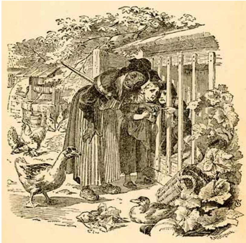
Dessin de Henry Altemus

– Holà ! Grethel, cria-t-elle, dépêche-toi d'apporter de l'eau. Que Hansel soit gras ou maigre, c'est demain que je le tuerai et le mangerai.