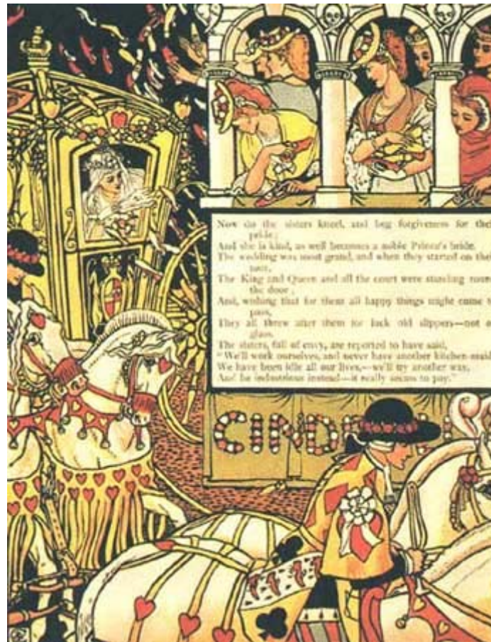
Dessin de Walter Crane