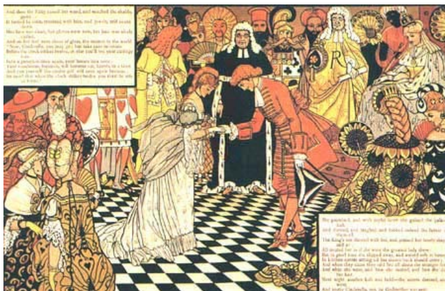
Dessin de Walter Crane

« Petit arbre, ébranle-toi, agite-toi, jette de l'or et de l'argent sur moi. »