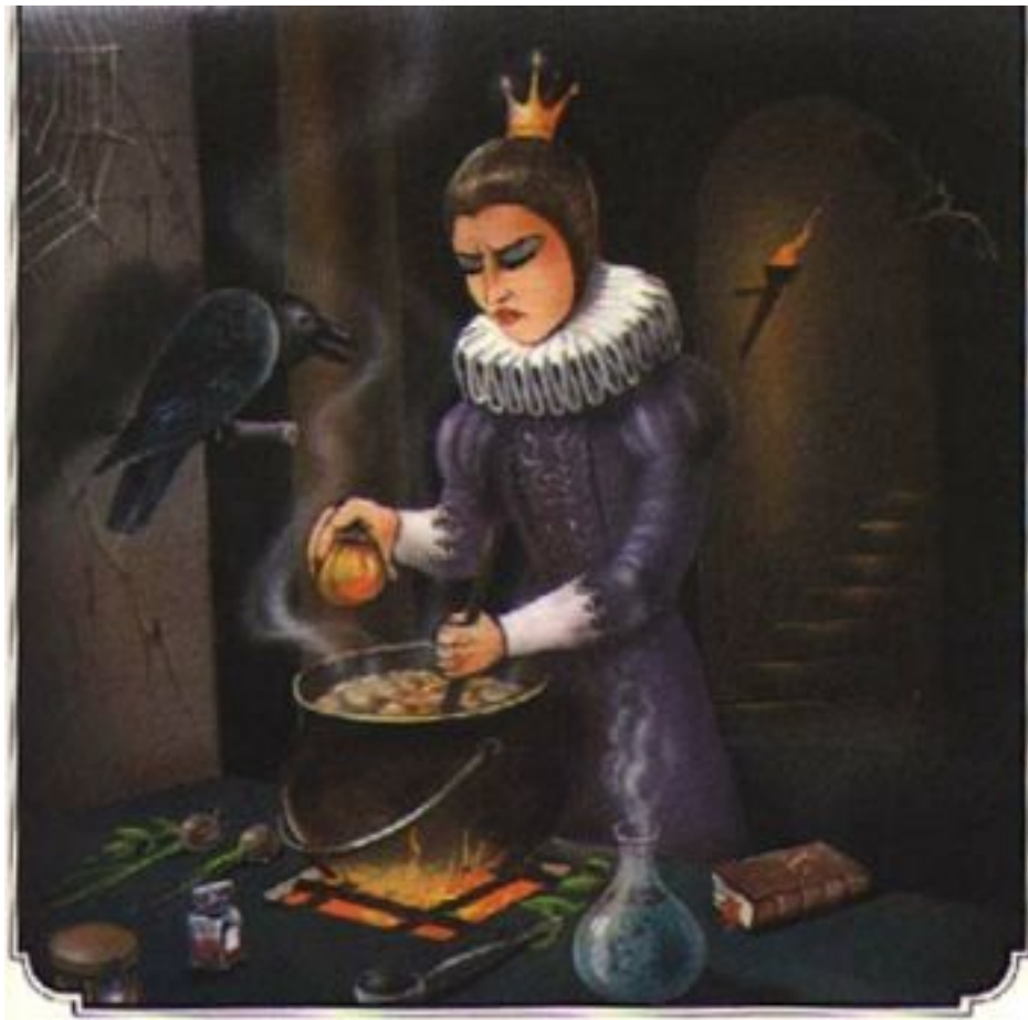
Dessin de Tuvia Kurtz

Cette réponse fit trembler la reine de rage et de jalousie. Elle jura que Blanche neige mourrait, dut-elle mourir elle-même. Elle alla dans son cabinet secret et prépara une pomme empoisonnée. Celle-ci était belle et appétissante. Cependant, il suffisait d'en manger un petit morceau pour mourir. La reine se maquilla, s'habilla en paysanne et partit pour le pays des sept nains. Arrivée à la maisonnette, elle frappa à la porte.