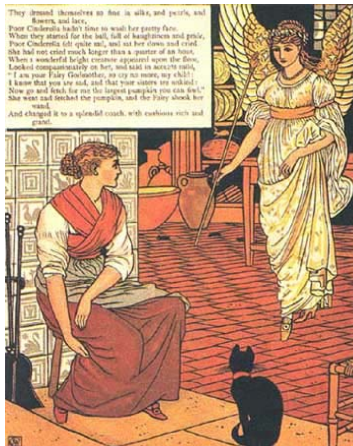
Dessin de Walter Crane

Alors l'oiseau lui lança une robe d'or et d'argent, ainsi que des pantoufles brodées de soie et d'argent. Elle mit la robe en toute hâte et partit à la fête. Ni ses sœurs, ni sa marâtre ne la reconnurent, et pensèrent que ce devait être la fille d'un roi étranger, tant elle était belle dans cette robe d'or. Elles ne songeaient pas le moins du monde à Cendrillon et la croyaient au logis, assise dans la saleté, à retirer les lentilles de la cendre. Le fils du roi vint à sa rencontre, a prit par la main et dansa avec elle. Il ne voulut même danser avec nulle autre, si bien qu'il ne lui lâcha plus la main et lorsqu'un autre danseur venait l'inviter, il lui disait : « C'est ma cavalière ».