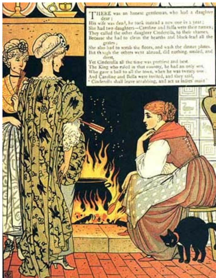
Dessin de Walter Crane

les dans la cendre, de sorte qu'elle devait recommencer à les trier. Le soir, lorsqu'elle était épuisée de travail, elle ne se couchait pas dans un lit, mais devait s'étendre près du foyer dans les cendres. Et parce que cela lui donnait toujours un air poussiéreux et sale, elles l'appelèrent « Cendrillon ».