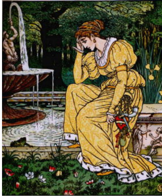
Dessin de Walter Crane

Elle regarda autour d'elle pour voir d'où venait la voix et aperçut une grenouille qui tendait hors de l'eau sa tête grosse et affreuse.