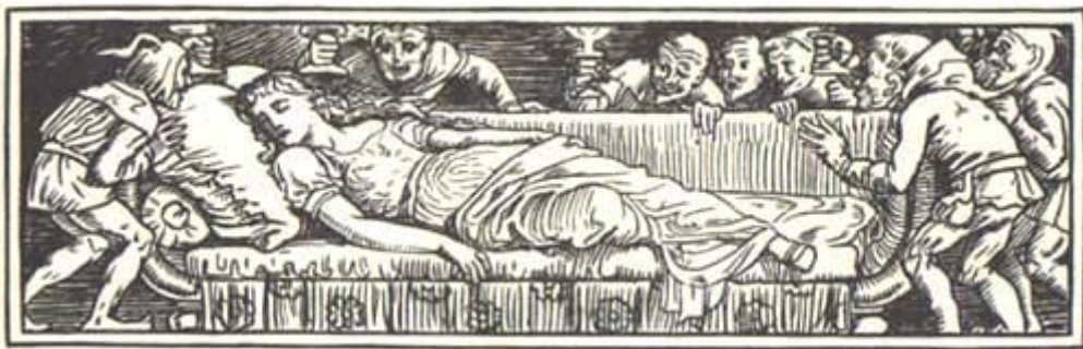
Dessin de Walter Crane

Ils la laissèrent dormir, la veillant avec amour.