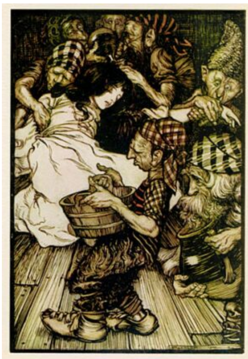
Dessin de Arthur Rackham

Le soir, en rentrant, les sept nains furent épouvantés à la vue de Blanche neige gisant à terre, sans vie. Apercevant le corselet tellement serré, ils coupèrent immédiatement les lacets. Blanche neige peu à peu revint à la vie.