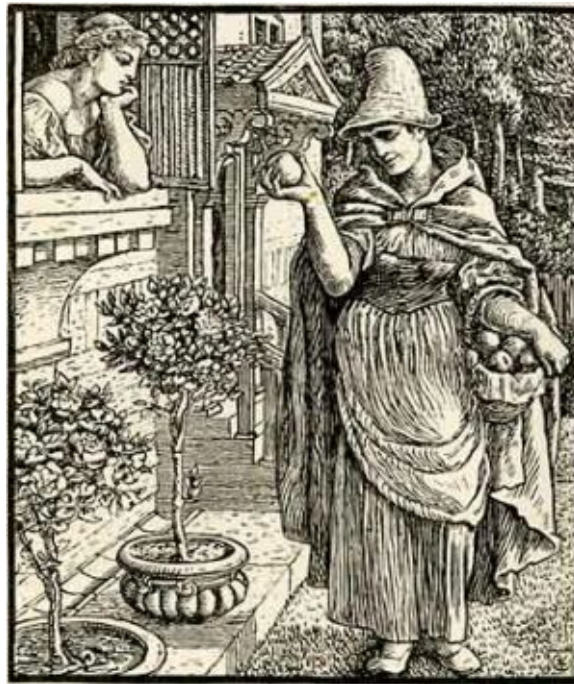
Dessin de Walter Crane