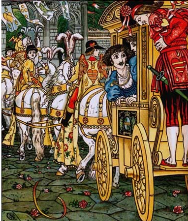
Dessin de Walter Crane

transformé en grenouille qu'il s'était fait bander la poitrine de trois cercles de fer pour que son cœur n'éclatât pas de douleur. La voiture devait emmener le prince dans son royaume. Le fidèle Henri l'y fit monter avec la princesse, et s'installa de nouveau à l'arrière, tout heureux de voir son maître libéré du mauvais sort.