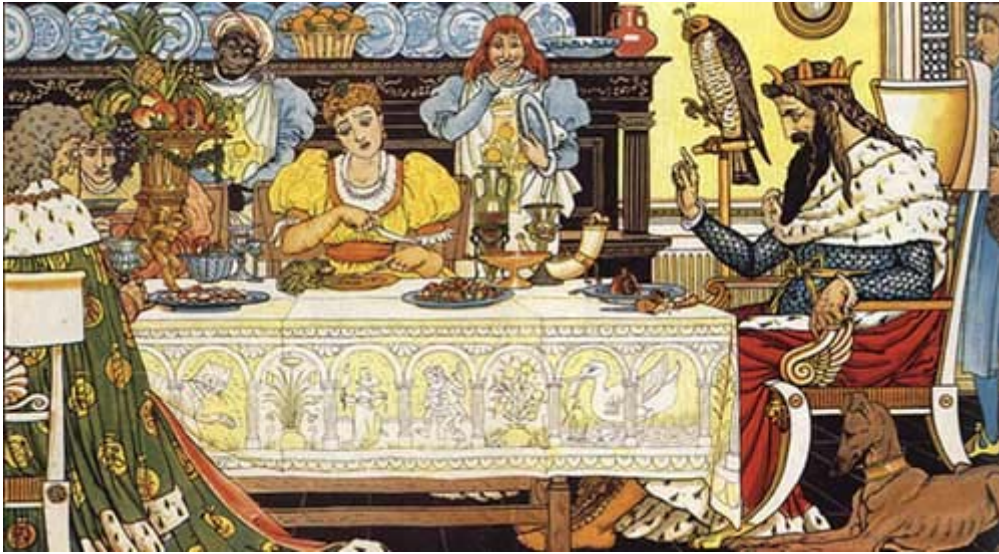
Dessin de Walter Crane

La princesse fit ce qu'on voulait, mais c'était malgré tout de mauvais cœur. La grenouille mangea de bon appétit ; quant à la princesse, chaque bouchée lui restait au travers de la gorge. À la fin, la grenouille dit :