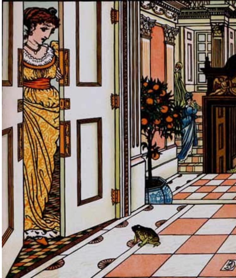
Dessin de Walter Crane

– Que crains-tu, mon enfant ? Y aurait-il un géant derrière la porte, qui viendrait te chercher ?